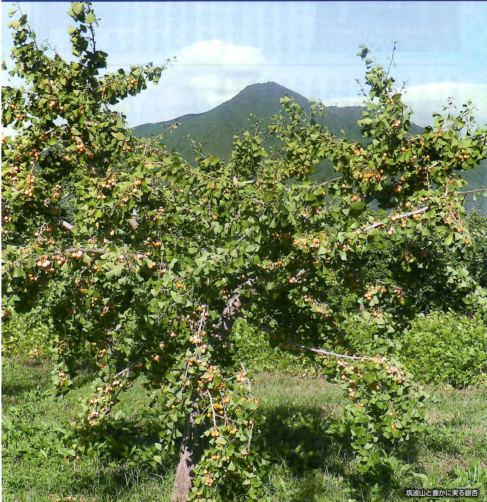
筑波山と豊かに実る銀杏