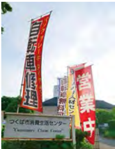
サービスステーションはシルバーののぼりが目印