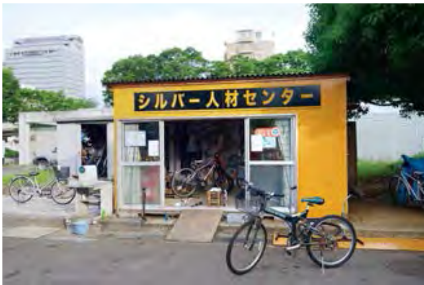
サービスステーション

研修、訓練をした経験豊富な8名のメンバーで運営を行っております。中には専門的な知識・技能を持った自転車技士、自転車安全整備士の資格者もおり、修理、交換、取付、点検、調整等愛車のメンテナンスまた、リサイクル車の販売、防犯登録・TSMマーク（賠償責任補償、損害補償）、不要自転車の無料引取りを行っております。