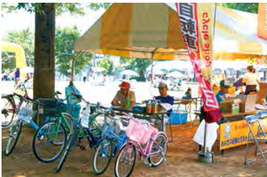
2015年8月まつりつくば2015に出店