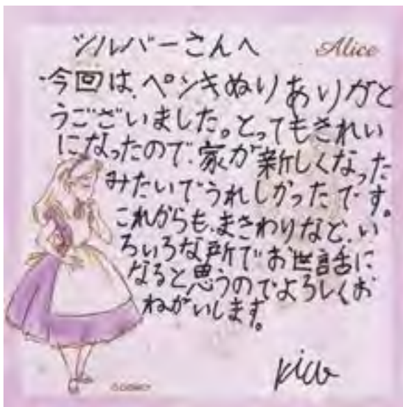
可愛い女の子からのラブレター