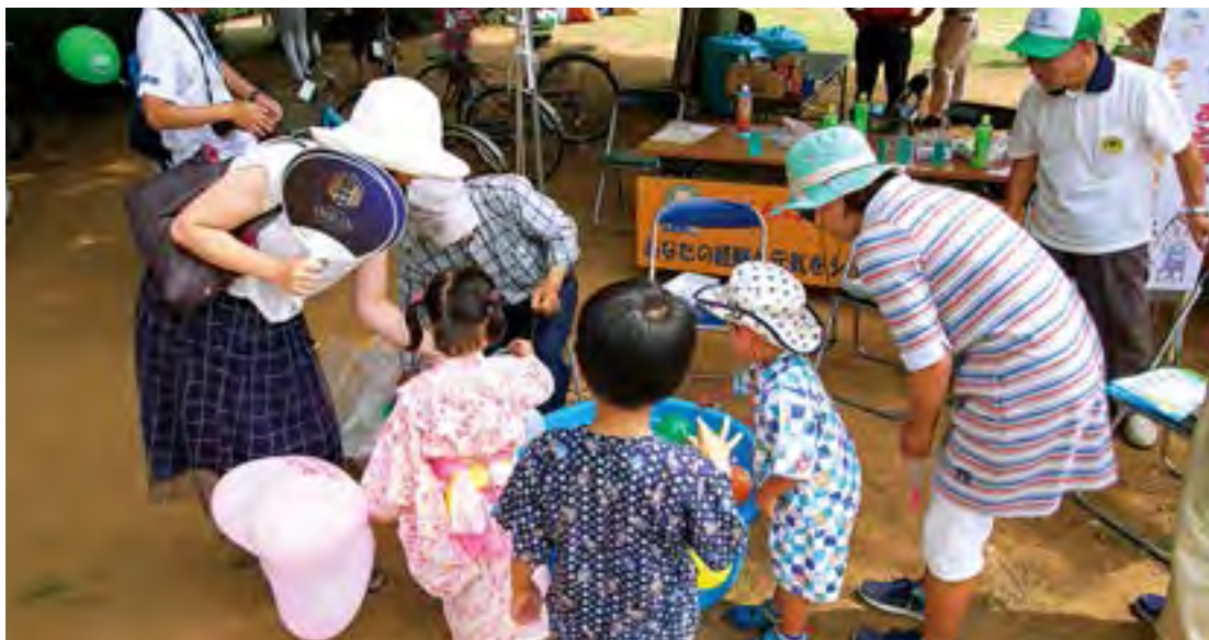
だれでも参加できるつくばまつりですが、主役はやはり子どもたちでした

TXつくば駅周辺を会場として開催され、つくば市シルバー人材センターも、全力をあげてこの大会に取り組みました。例年に比べて、今年はずっとの規模がさらに拡大され、何処もたい