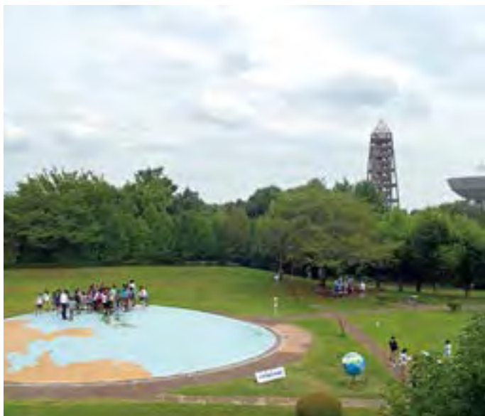
屋外には、地球広場（左）、測量用航空機「くにかぜ」（右）