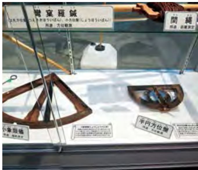
展示室：昔の測量器具