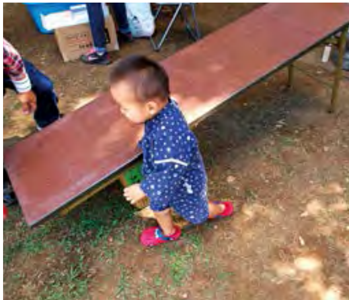
スライムボール転がしに夢中の坊や