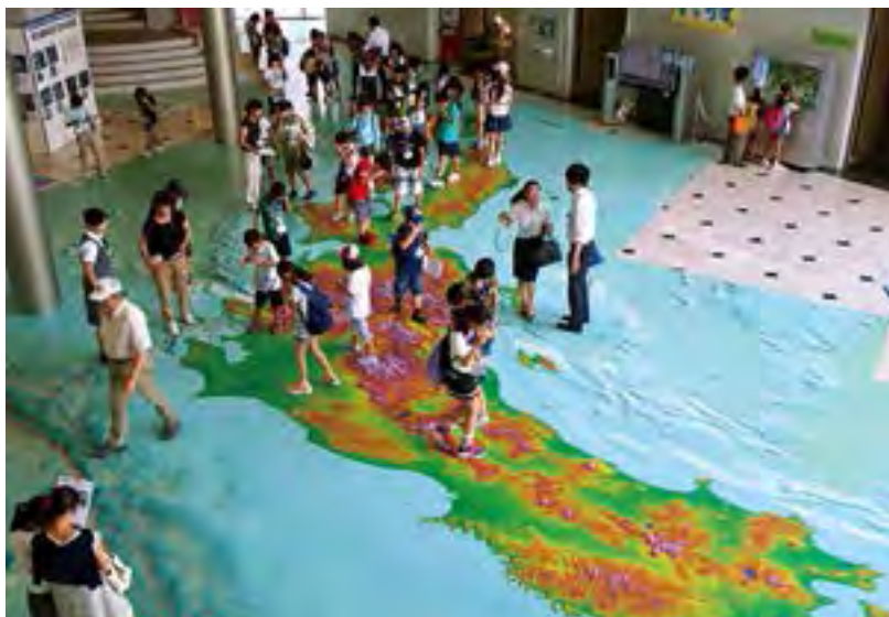
1階：子供たちに大人気の3Dで見られる立体日本列島空中散歩マップ。写真右上に、地図記号の表示板