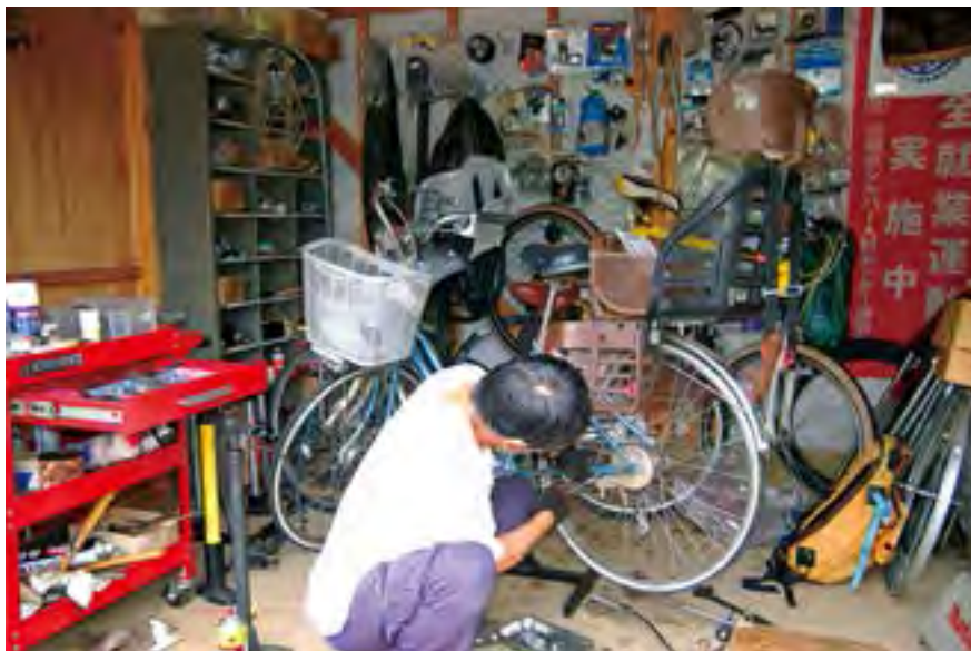
サービスステーション内で修理作業中

研修、訓練をした経験豊富な8名のメンバーで運営を行っております。中には専門的な知識・技能を持った自転車技士、自転車安全整備士の資格者もおり、修理、交換、取付、点検、調整等愛車のメンテナンスまた、リサイクル車の販売、防犯登録・TSMマーク（賠償責任補償、損害補償）、不要自転車の無料引取りを行っております。