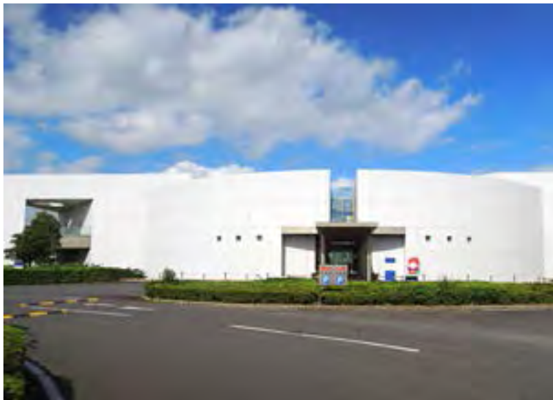
科学館の正面-入り口右手にマスコットのマップー

ました。この企画展には、子供たちだけでなく大人たちにも分かるように工夫された企画が多いと感じました。9月上旬現在実施中のプログラムをあげてみましょう。