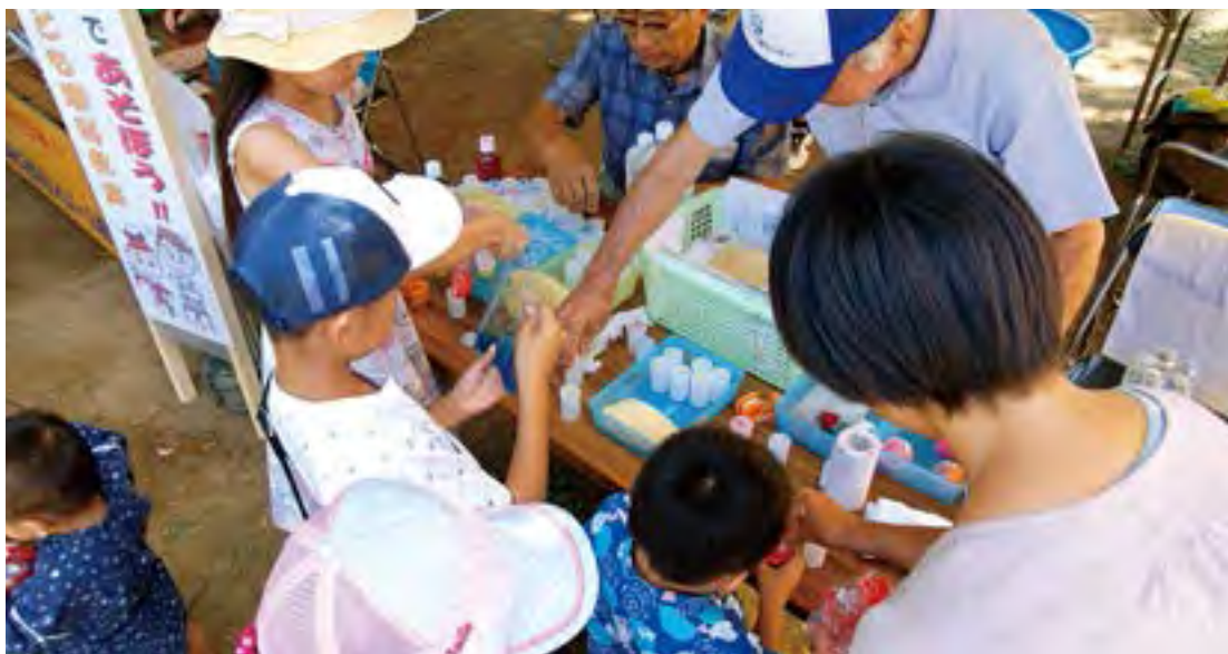
当センター初の試みとして開いた、こども理科教室コーナー「スライムであそぼう！」が超人気

へんな人混みで、大いに賑わいました。2011年3月のあの震災以降、やっとここまで盛り上がりつつあるというのが、市民みなさんの率直な思いではなかったでしょうか。