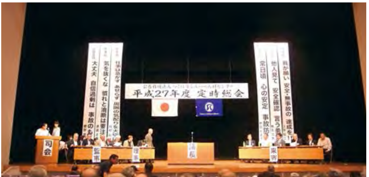
(開会直前の定時総会会場)

シルバー人材センターは、つくば市においては、昨年は子育ての活動の中で一時預かりの事業を提案していただき、現在その活動をしていただいている訳でございます。皆さん自身が様々な提案をしていただく、私も一緒に作って協力しながら共に働く場を作っていくとか、そして子育て支援のように地元の住民が必要としている、そういうものを積極的に活動として作り出す。こういうことが今後も実現できれば、地域住民に大きくこのシル