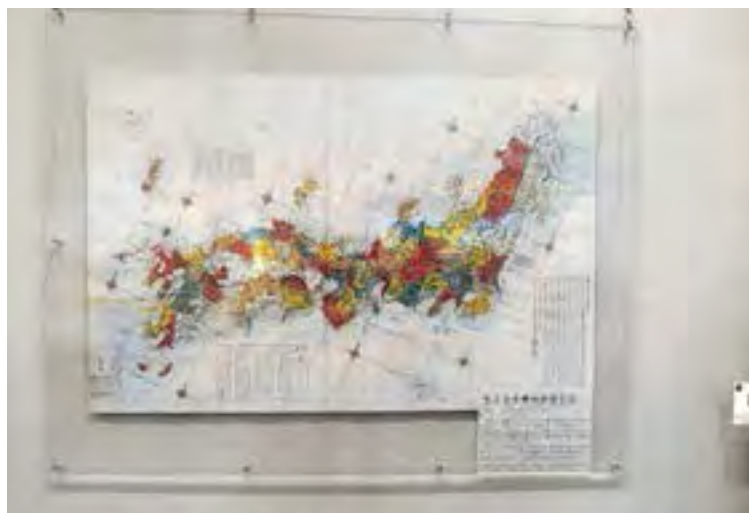
国土地理院が所蔵する貴重な古地図展示室：展示物の一つが、江戸後期に長久保赤水（ながくほせきすい）により作成された、日本最初の日本全国を複製した「改正日本輿地路程全図」（かいせいにほんよちろろていぜんず）。縮尺約130万分の一。江戸時代、一般庶民に広く普及。