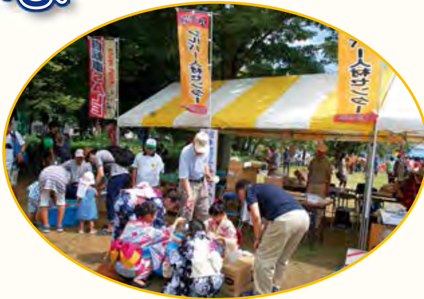
まつりつくば 2015 に参加