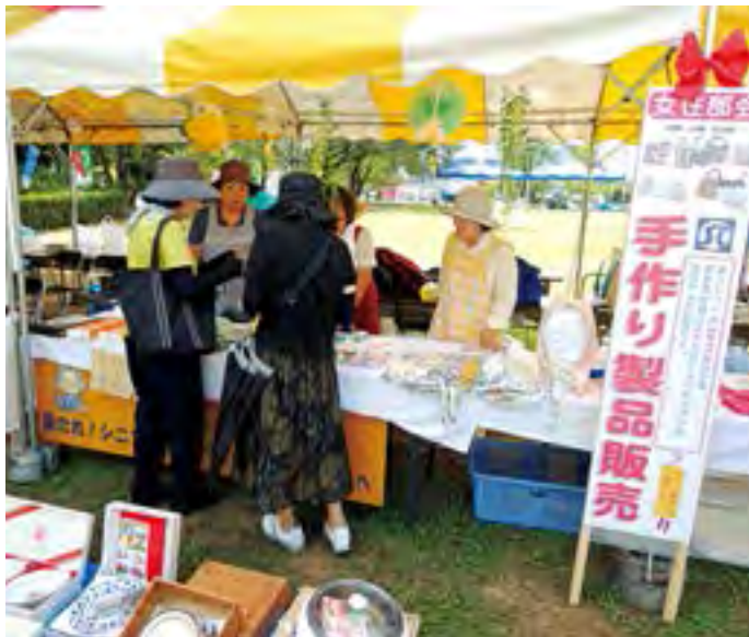
女性部会の手作りグッズコーナー